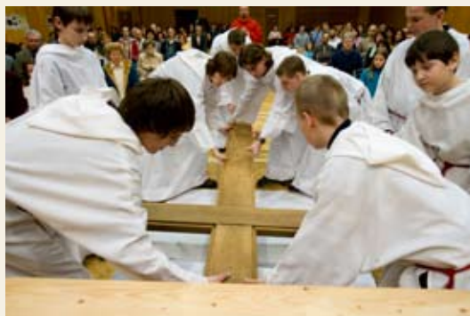
Velikonoce v tělocvičně

Připravujeme zadání pro architektonickou soutěž na stavbu kostela s komunitním zázemím. Pozemky jsou ve vlastnictví farnosti Líšeň a v současnosti je na nich málo používané škvárové hřiště a bývalé zařízení staveniště – „likusák“ v němž sídlí nadace a bydlí dvě třetiny líšeňské komunity salesiánů. Stavbou kostela se zázemím bude ukončen komplex budov střediska mládeže.